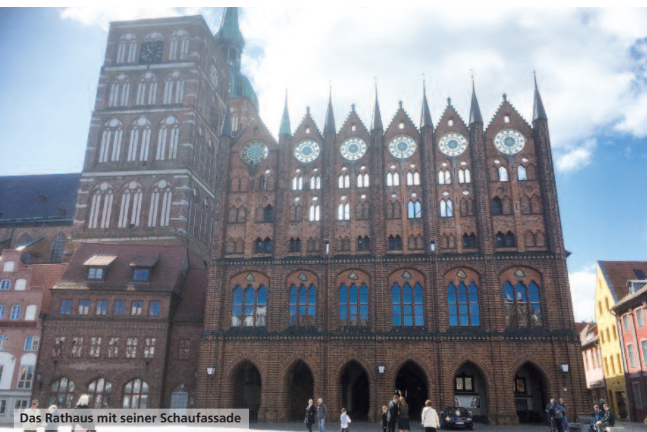
Das Rathaus mit seiner Schaufassade

Unbedingt sehenswert ist die Kirche St. Nikolai. Sie wurde im 13. Jahrhundert erbaut und ist die älteste der drei mittelalterlichen Pfarrkirchen der Stadt. Ein riesiges, kunstvoll geschnittenes Portal führt in die dreischiffige Basilika. Das Innere ist farbenprächtig bemalt, reich ausgestattet und beherbergt mehrere aufwändig gestaltete Altare, Kapellen und Grabplatten, eine monumentale astronomische Uhr sowie eine Kanzel aus dem Jahr 1611.