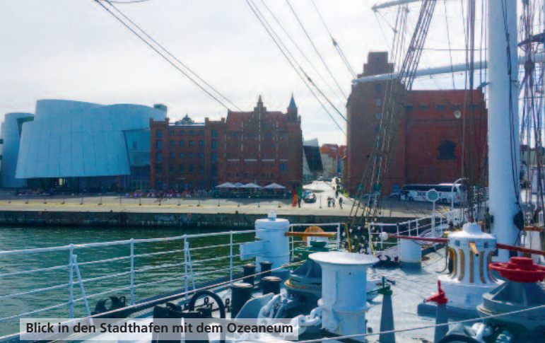
Blick in den Stadthafen mit dem Ozeaneum