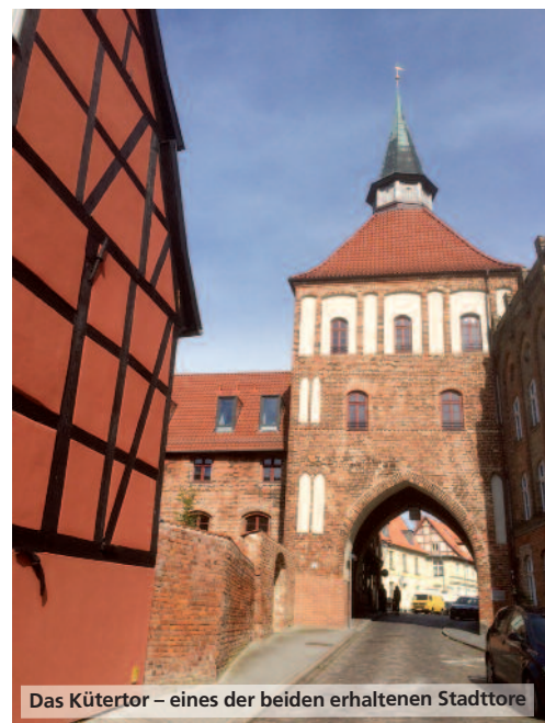
Das Kütertor – eines der beiden erhaltenen Stadttore

Stralsunder Hafenbecken über die Nordsee bis ins Nordpolarmeer. Sie zeigen die maritimen Lebensräume vom Bodden bis zum offenen Atlantik. So tummeln sich im Aquarium „Stralsunder Hafenbecken“ die typischen Bewohner des nur wenige Meter entfernten Hafens der Stadt: Flussbarsche und Flusssaale, Plötzen und Rotfedern. Aber auch anderes ist hier zu sehen, was nichts im Meer zu suchen hat: ein verrostetes Fahrrad und ein rostiger Einkaufswagen – beides wurde im Hafenbecken gefunden.