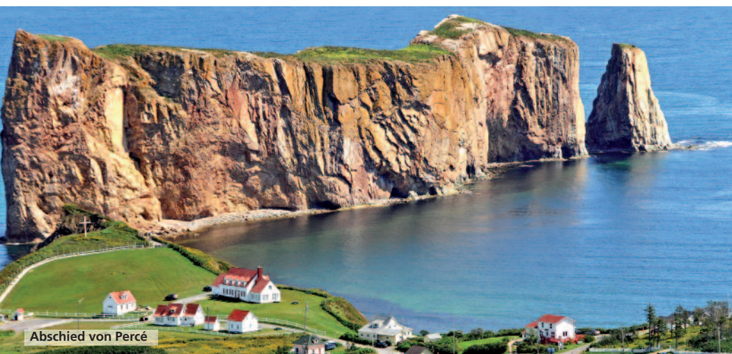
Abschied von Percé

Nach dem Frühstück machen wir uns auf den Weg. Es regnet, und es ist deutlich kälter geworden. Wir müssen zur Fähre, denn wir sind auf der Nordseite des Stromes, und hier führt die Straße in die unwirtlichen Breiten Neufundlands. Wir wollen aber auf der Südseite zur Gaspésie. Gegen 13 Uhr erreichen wir das Ter-