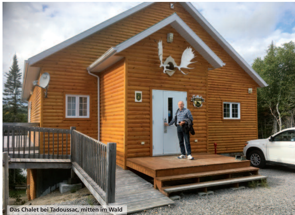
Das Chalet bei Tadoussac, mitten im Wald

Auf der Route 138 fahren wir zum Zwischenziel Tadoussac, einem idylli-