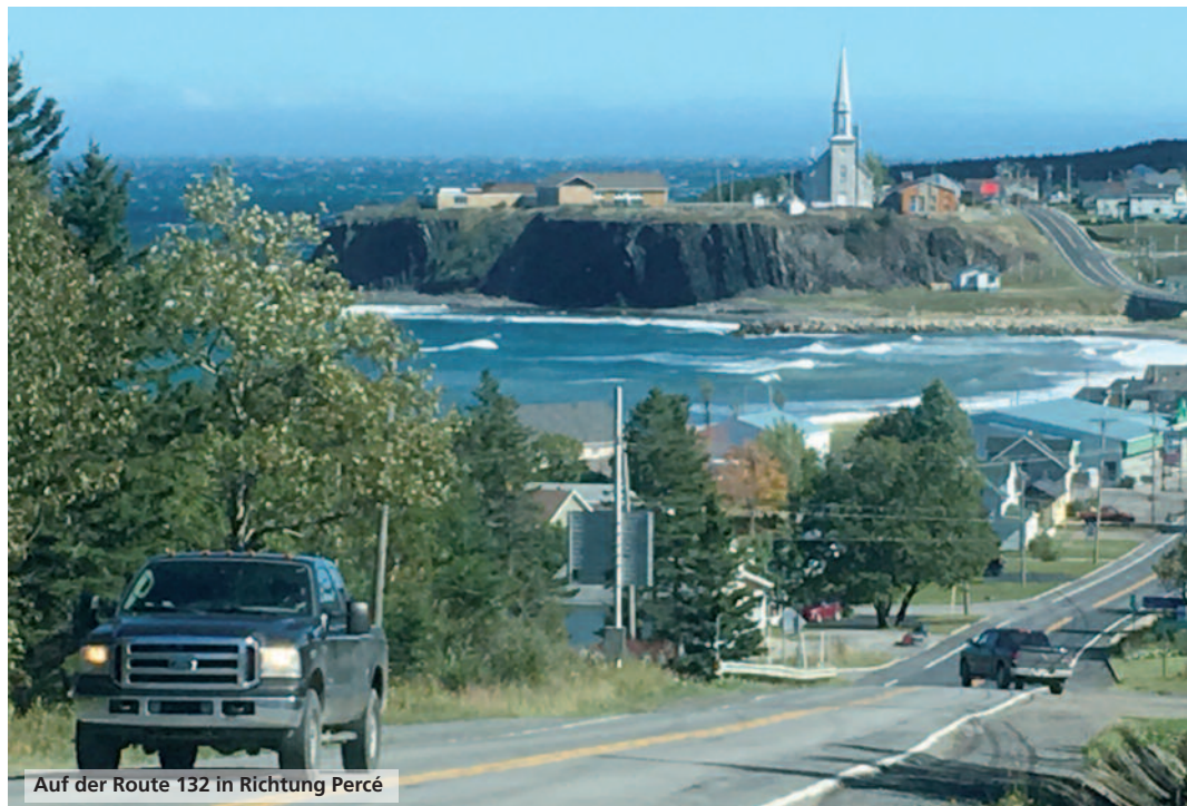
Auf der Route 132 in Richtung Percé

Doch an „unserem“ Tag auf der Route 132 ist der Himmel blau, und es weht nur ein leichtes Lüftchen, und jeder Blick, der sich dem Reisenden auf der schmalen Küstenstraße an den hohen, schroffen Felsgetümen öffnet, ist unbeschreiblich. Fast könnte man sagen: Der Weg ist das Ziel!