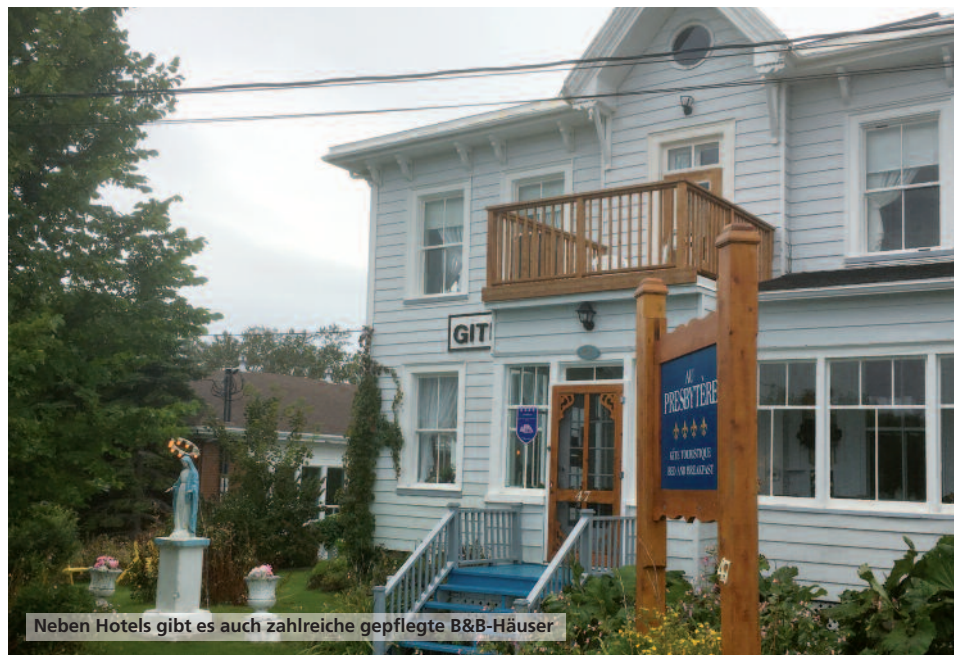
Neben Hotels gibt es auch zahlreiche gepflegte B&B-Häuser

600 Kilometern, nach grandiosen Blicken in die Natur, über die Insel, erreichen wir Rivière du Loup. Von hier aus starten Bootstouren zum Wale-Beobachten. Der Sankt-Lorenz-Strom ist eines der waldreichsten Gewässer der Welt. Wenn man Glück hat, kann man hier Zwergwale und