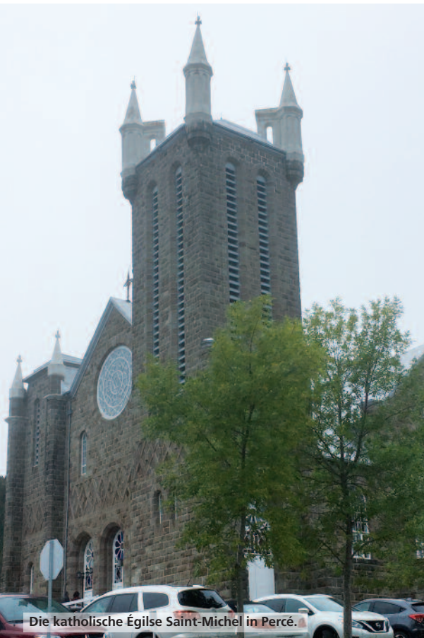
Die katholische Église Saint-Michel in Percé.

Und was isst man hier, am Ende der Welt? Natürlich das, was im Meer gefangen und frisch auf den Tisch kommt. Hummer, Garnelen, Jakobsmuscheln. Und daraus ein Gratin gezaubert – einfach toll, aber auch teuer: 125 Dollar kann man in einem guten Restaurant dafür hinlegen.